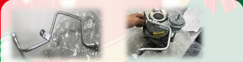
ちなみにこちらがターボチャージャーのオイルパイプです